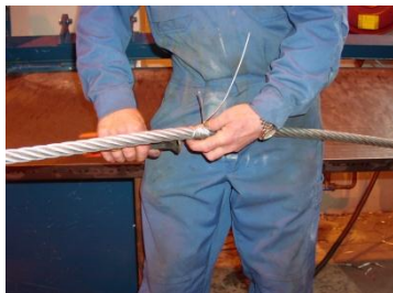
Montering av bendselwire

Deretter sikrer en enden på kabelstrømperen med en bendselwire eller en ståltråd ved å surre bendselwiren rundt enden av kabelstrømperen. Deretter ruller en tape over bendslingen slik at der ikke er noen skarpe kanter som kan henge seg fast under treding av wiren.