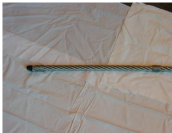
Bendselwire påmontert på i enden og inne på wire